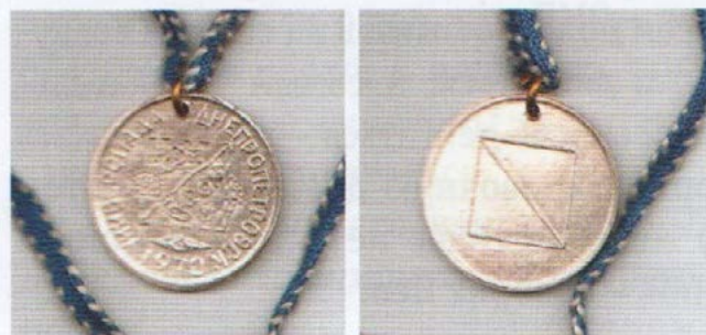
Фото 1-2. Медаль Универсиады 1970 года.

« ...Нам, бывшим студентам, а сейчас уже ветеранам, вспомнилось то время конца 60-х–начала 70-х годов, когда в студенческом спортивном обществе страны (в то время – ВДСО «Буревестник») «закладывались» первые прообразы будущих Всероссийских универсиад по ориентированию. Этими прообразами были товарищеские встречи университетских команд страны по ориентированию на местности. Они проводились по осени, после окончания «картошки» и других вариантов трудовых работ. Назывались тогда эти небольшие встречи серьезно – Матчи университетов СССР . Медали на тех встречах тоже были серьезные – медали Универсиад! Хотя команд собиралось немного. Традиционно состав команд был такой: руководитель, тренер, 6 юношей и 6 девушек (всего 14 человек). Программа короткая: день приезда, первый день – заданное направление, второй день – трехэтапные эстафеты в заданном направлении (по две мужские и две женские команды от ВУЗа) и день отъезда.