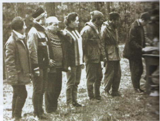
Фото 3. Команда организаторов Матча университетов СССР 1970 г. по ориентированию на местности (г. Днепропетровск).